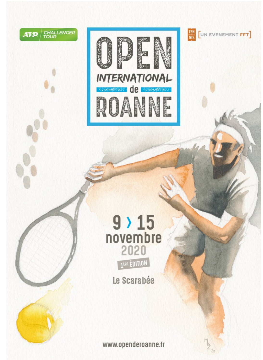
Affiche 2020 de l'Open international de Roanne

Pour plus d'informations : www.openderoanne.fr